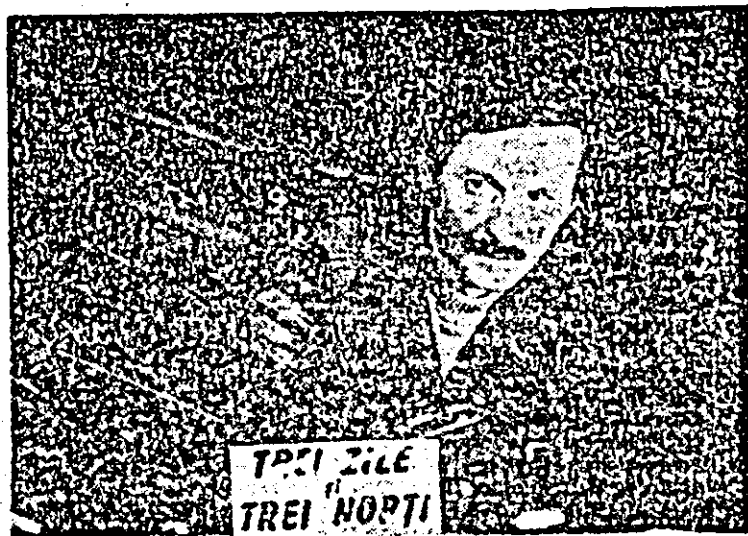
TRAI ZILE TREI NOPTI

Filmul rulează la cinematograful „Mureșul”.