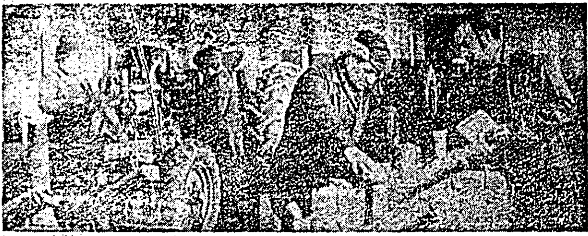
La I.A.S. Utiș, repararea tractoarelor este în toi.