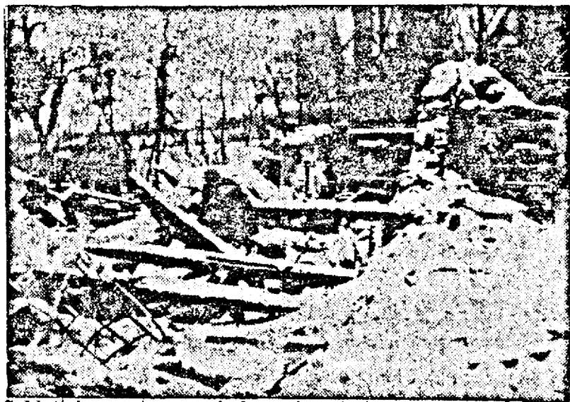
Soldați francezi ascunzându-se în ruinele unei case distruse