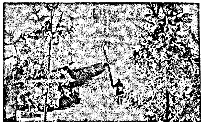
Un avion vânătoare francez luându-și zborul