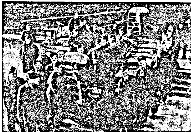
Aviatori englezi purtând coada unui avion german „Dornier“ doborât pe frontul francez