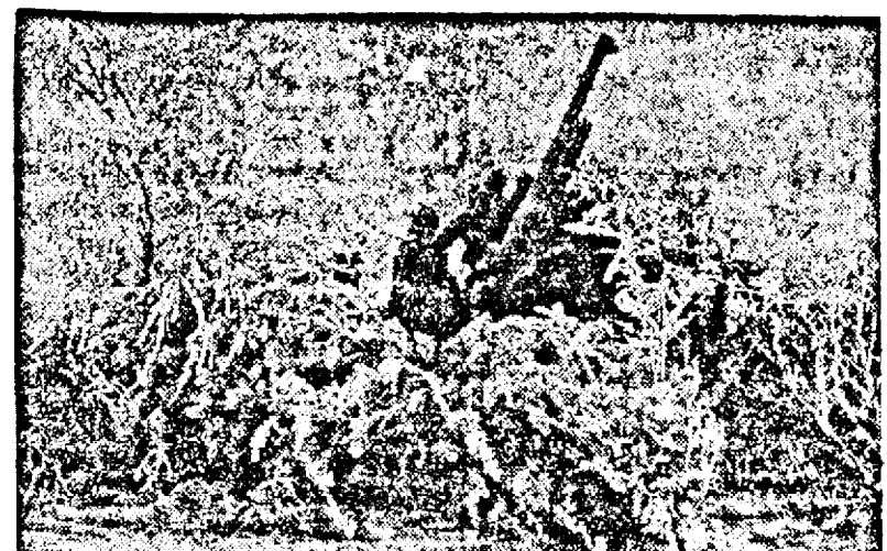
Un tun antiaerian în poziție de tragere