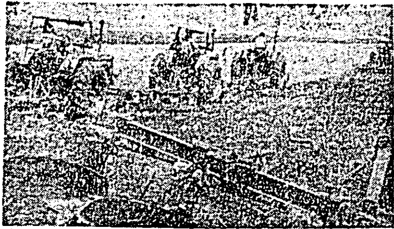
Pe ogoarele I.A.S. Lipova mecanizatorii trag brazde noi pentru recolta anului viitor.