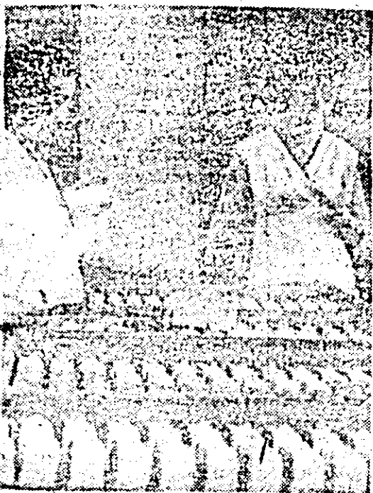
Competență profesională, exigență și răspundere sînt calitățile pe care trebuie să le întrunească cel care execută controlul final al calității la întreprinderea „Victoria”.