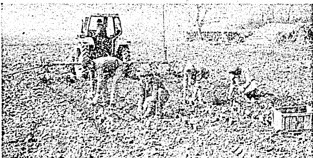
Aspect de la o lucrare la ordinea zilei în legumicultură — plantatul în câmp a verzei timpuriu la C.A.P. Sînlana.