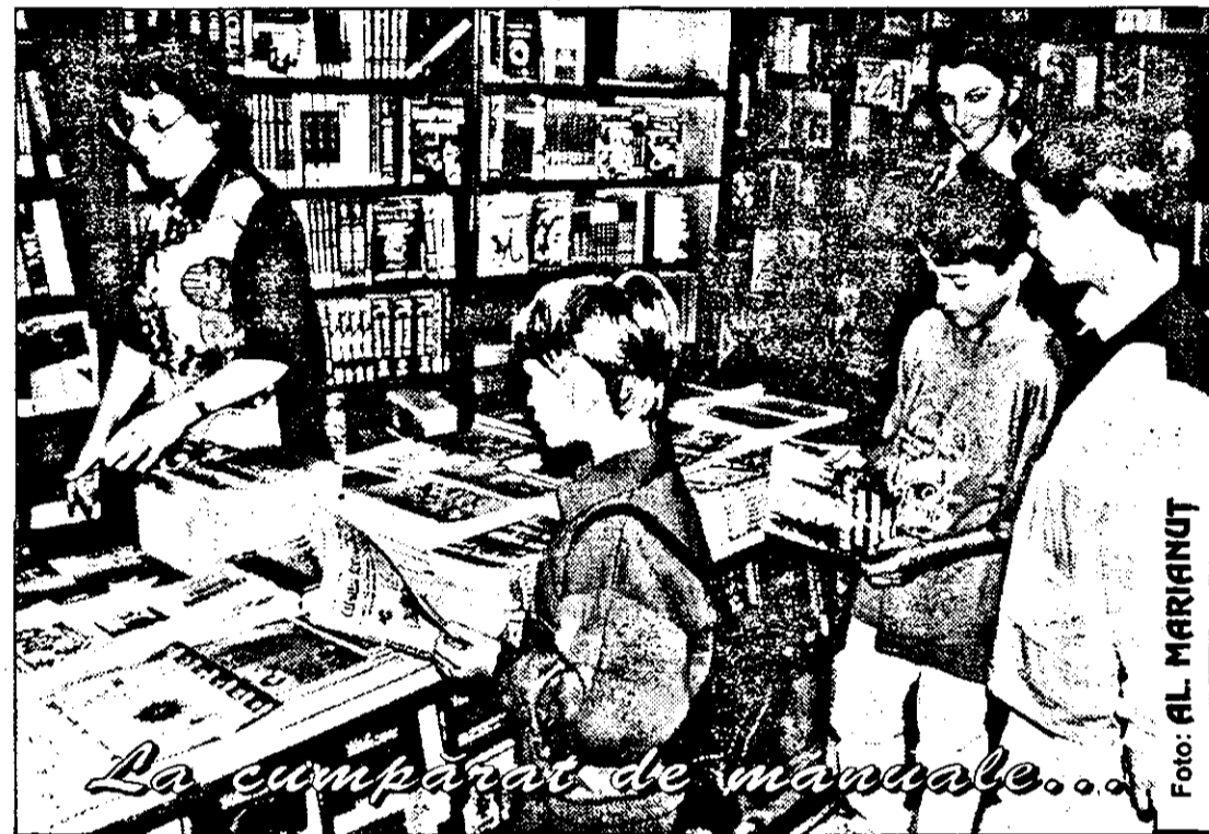
La cumpărarea de manuale...