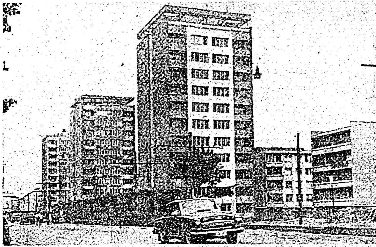
Impunătoarele blocuri construite în Arad în anul socialismului