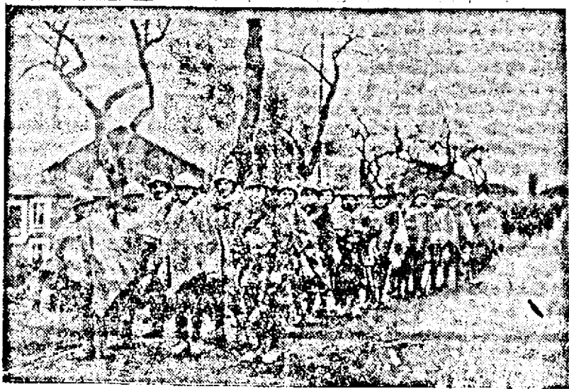
Trupele franceze în trând în linie

Geneva, 9 (Rador.) Guvernul Statelor Unite a răspuns la nota prin care secretariatul general al Societății Națiunilor ceruse la 18 Decembrie 1939 statelor membre și nemembre ale S. N. să-și arate intențiile cu privire la un eventual ajutor material și umanitar pentru Finlanda. Răspunsul guvernului american va fi publicat fără întârziere, fie la Washington, fie la Geneva. Se crede că guvernul Statelor Unite formulează în răspunsul său urarea ca inițiativele ce s'ar lua în favoarea Finlandei să fie coordonate pentru a se evita confuziile.