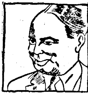
Lord Hoare Belisha

Lordul McMillan, ministrul informațiilor, a demisionat deasemenea