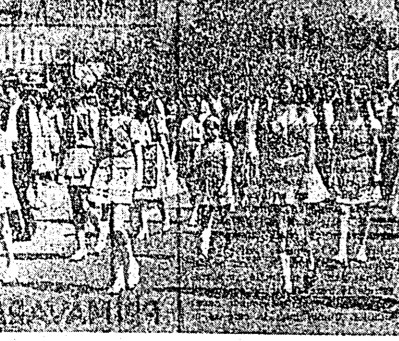
Din polioromia portului popular.