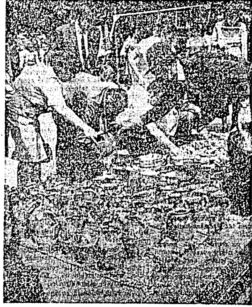
Îlirgul de artă populară a cunoscut din primele clipe o mare afluență.