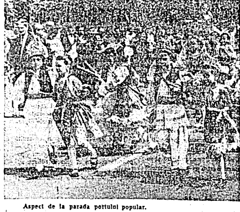
Aspect de la parada portului popular.