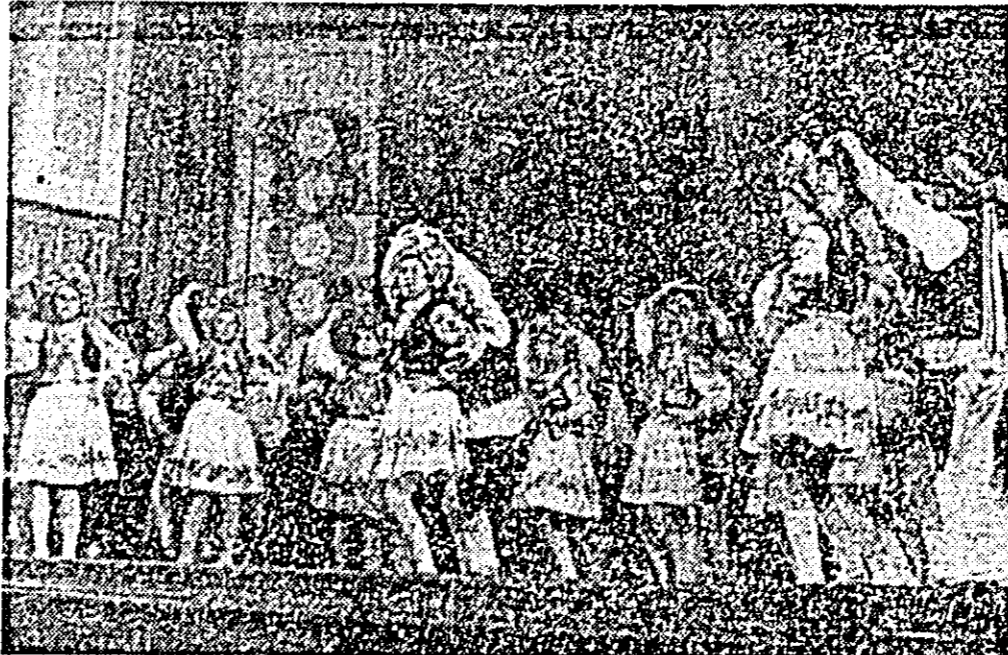
Secvență din spectacolul festiv ce a avut loc pe scena Palatului cultural la încheierea „Primăverii arădene“.

Tuturor dect, mulțumim, felicităm și gratulăm noastră, la care se adaugă — sistem sigur — aceleași gladiuri și sentimente din partea spectatorilor.