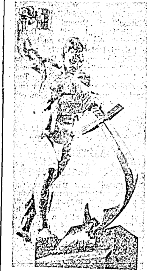
E. V. BUCIETICI: Din palos plug.

Desfășurîndu-se o mai susținută activitate culturală se va contribui din plin la bunul mers al gospodăriei, la obținerea de noi succese la muncă. ȘT. I.