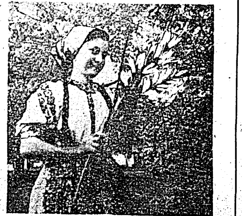
Porti de față, comuna Cuied, județul Arad.