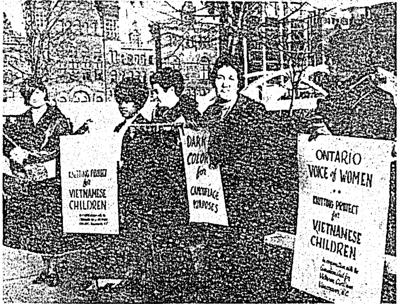
CANADA — Aproximativ 2.000 de femei din provincia Ontario au organizat o demonstrație in sprijinul copiilor vietnamezi.

TEL AVIV 21 (Agerpres). — Trei avioane de vânătoare egiptene au fost distruse și un altul avariat in cursul unor ciocniri care au avut loc miercuri in zona Canalului de Suez, a anunțat la Tel Aviv un purtător de cuvânt militar. Incidentele au avut loc la nord de El Kantara și in zona Lacurilor Amare. In momentul in care un număr de avioane egiptene au încercat să treacă de cealaltă parte a liniei de încetare a focului. Purtătorul de cuvânt a declarat că nu au fost înregistrate pierderi de partea israeliană.