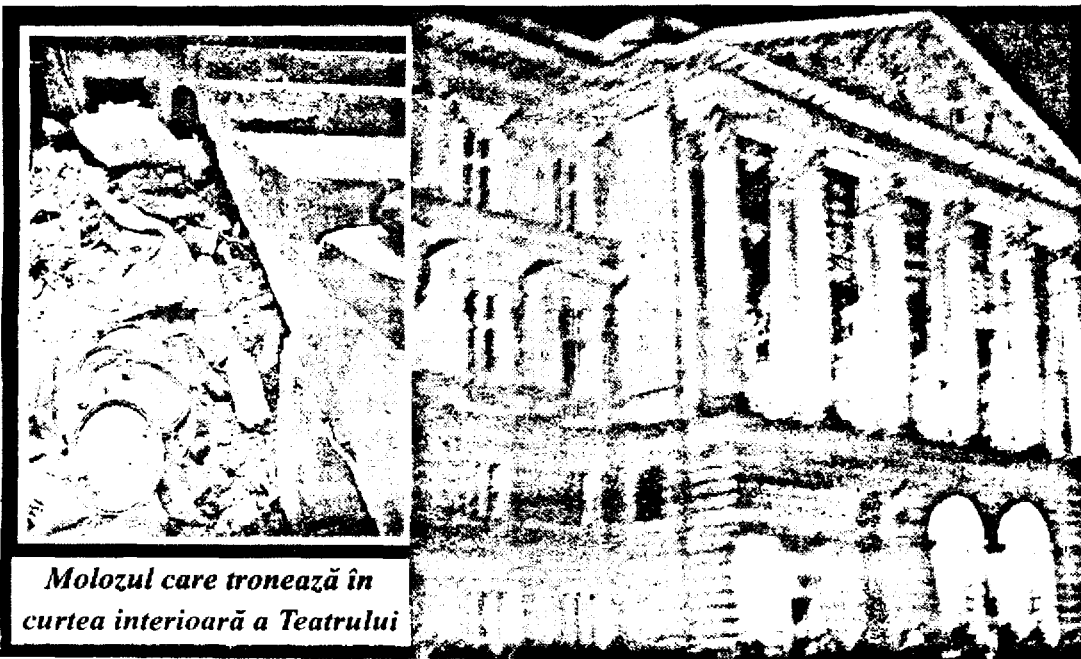
Molozul care tronează în curtea interioară a Teatrului