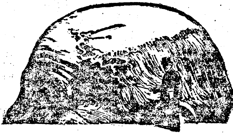
A halánték ereinek megdagadása az érlemezésedés kezdetét jelenti.

Az ereknek is megvannak az életkoruk; igyekezzenek ereiket fiatalon fenntartani; ezáltal elkerülhetik, hogy a véredények megkeményedjenek, mint a pipaszár, vagy más szakkal, törékenyek és porhanyósak legyenek.