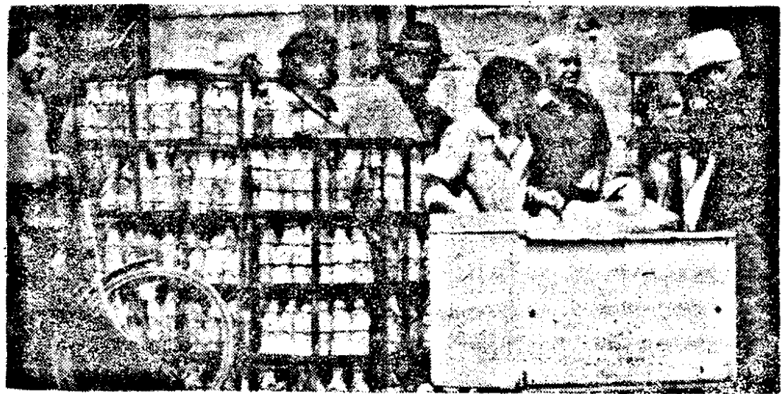
A venit laptele...