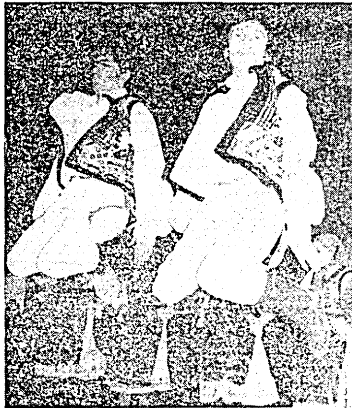
Formația de dansuri populare din Curtici la faza pe consiliul agroindustrial a Festivalului național „Cîntarea României”.