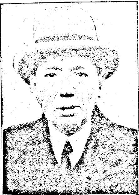
D. N. TITULESCU

Afară de Tuka mai sunt doi acuzați de complicitate.