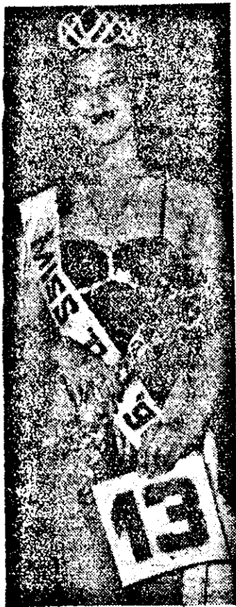
Nu sînt, nu supt, ci misst

Prima bancă cu capital privat din jud. Arad angajează specialiști în activitate bancară în următoarele condiții: 1. Persoane cu studii economice medii și superioare, care au lucrat efectiv în probleme bancare (casierie, contabilitate decontări, creditări și operațiuni valutare). 2. Ținută morală impecabilă. 3. Pensionari care au lucrat în domeniul bancar pe bază de convenție sau permanent, după cum le permite situația. Relații la tel. 37722. (1099)