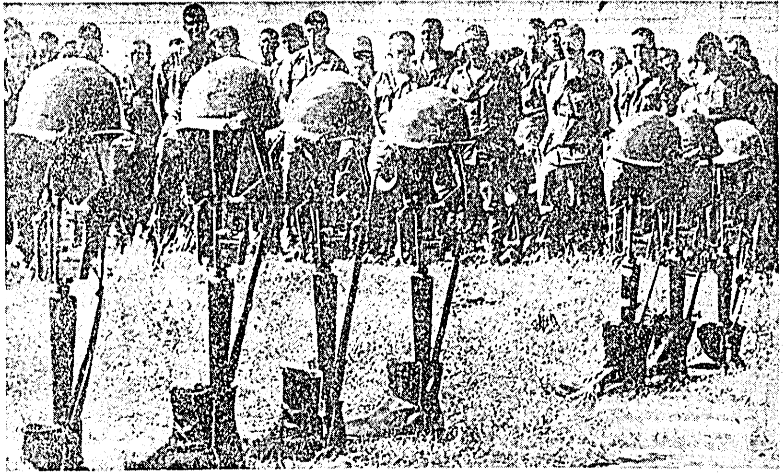
...Care ne va fi soarta? — gîndesc nu pușini din soldații americani asistînd „undeva” în Vietnamul de sud, la înmormîntarea camarazilor.

Pierderi grele suferite de forțele americane SAIGON 14 (Agerpres). — În cursul anului 1965, forțele patriotice sud-vietnameze au scos din luptă aproximativ 20.000 de militari americani, ceea ce depășește de 5 ori numărul soldaților americani uciși sau răniți în perioada 1961-1964, scrie ziarul „Quan Gial Phong”, organul Armatei de eliberare din Vietnamul de sud. La aceeași perioadă, arată ziarul, forțele americane au pierdut 1.500 de avioane de diferite tipuri — doborâte, distruse sau avariate — în afara celor peste 800 de avioane doborâte în R. D. Vietnam. „Acest lucru, scrie ziarul, dovedește clar, că pe măsură ce efectivul trupelor americane aduse în Vietnam devine tot mai mare, pierderile suferite de acestea sînt tot mai grele, precum și că forțele americane sînt neputincioase în a împiedica prăbușirea armatei și administrației saigoneze”.