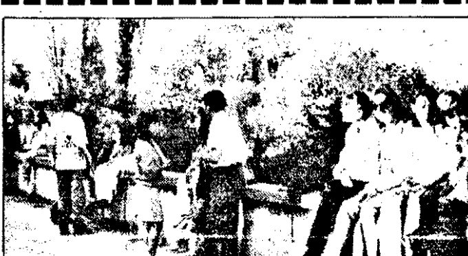
Clipe de destindere pe faleza Muresului...