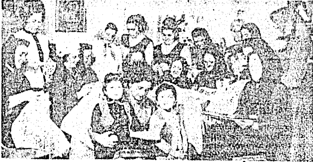
Moment din timpul șezătorii de la casa nr. 1104 din Peclca.