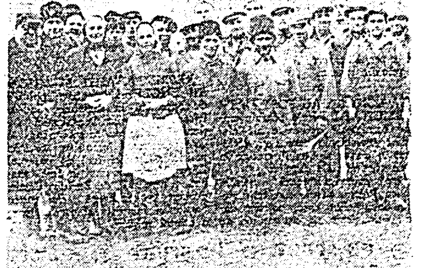
In clișeu de mai sus vă prezentăm o parte dintre ingrijitorii de animale de la gospodăria colectivă „Steagul roșu” din Pecica.