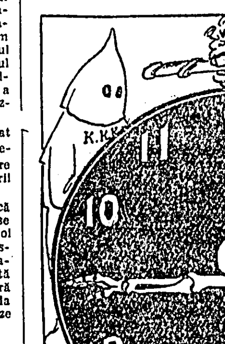
CEAS AMERICAN (desen de A. Drunin din „Moldova Socialistă”)

„In anul 1961 numărul crimelor săvîrșite în S.U.A. a ajuns la cel mai înalt nivel din toată istoria țării”, — recunoaște directorul Biroului Federal de Investiții Edgar Hoover. Potrivit datelor furnizate de el, în SUA la fiecare 58 de minute are loc un omor.