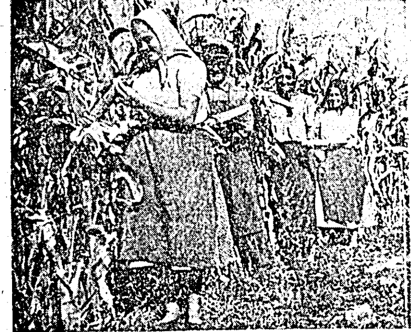
În apropierea Mureșului, gospodăria agricolă colectivă din Vladimirescu are o tarla de 30 de hectare de porumb pe care în acest an a aplicat tratamentul culturii obținându-se producții sporite. ÎN CLISEU: se vad unii din membrii echipei speciale care au îngrijit porumbul, lucrînd la recoltat.

ÎN CLISEU: aspect de la expoziția „U.R.S.S. azi”.