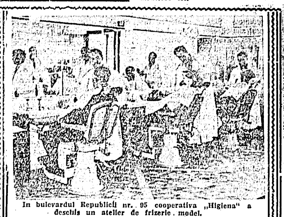
In bulevardul Republicii nr. 95 cooperativa „Higiena” a deschis un atelier de frizerie model.