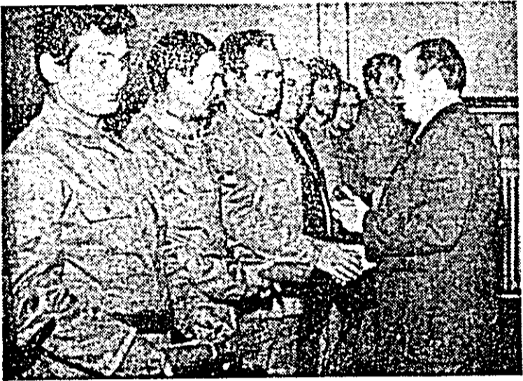
Fotografia prezintă reprezentanți ai gârzilor patriotice și membri ai Comitetului județean Arad al P.C.R. în timpul ceremoniei de înmințare a distincțiilor.