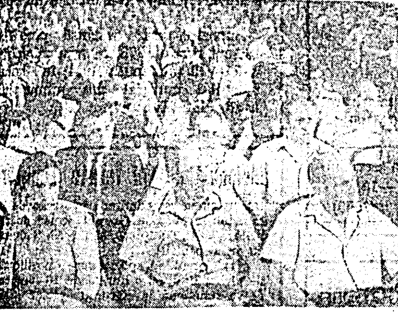
Aspect din timpul sesiunii de lucru a cadrelor didactice.

Cu acest prilej s-au jalonat câteva sarcini care revin profesorilor de științe sociale, dintre care reținem în mod deosebit necesitatea studierii și dezbaterii în seminarii, cu elevii, a bibliografiei de specialitate, antenarea literaturii școlare la activitatea politică cetățenească, transformarea tuturor cabinetelelor de științe sociale în instrumente eficiente de studiu, preocuparea pentru activitatea de cercetare a unor probleme de istoria locală și publicarea unor materiale științifice și metodice.