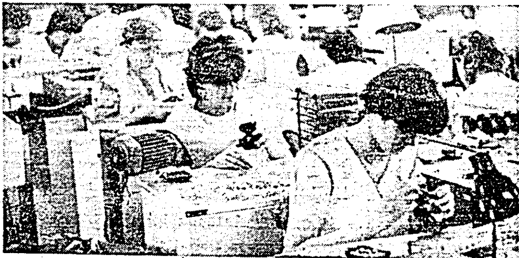
Aspect de muncă în secția montaj a întreprinderii de ceasuri „Victoria”, colectiv frunșag în întrecerea socialistă.