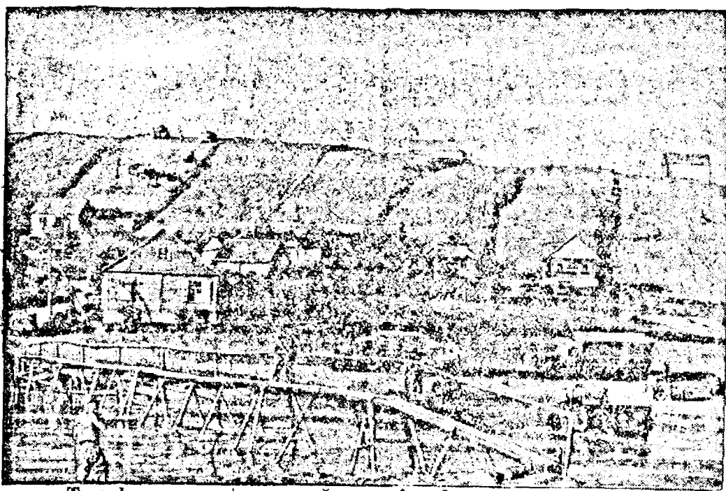
Trupele germane traversează un râu de pe frontul sovietic.