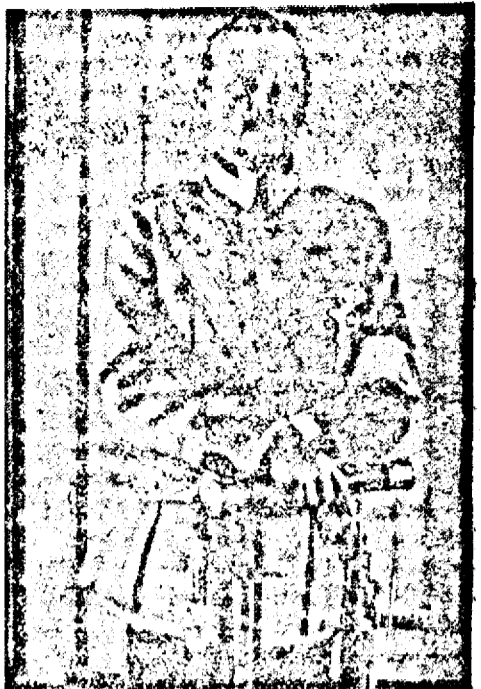
Mareșalul Mannerheim, comandantul armatelor germano-finlandeze de pe frontul finlandez.

Consiliul de miniștri și-a întreruns la ora 5 lucrările pentru ca întreg consiliul să meargă la gara Mogoșoaia pentru a primi un tren cu răniți de pe front.