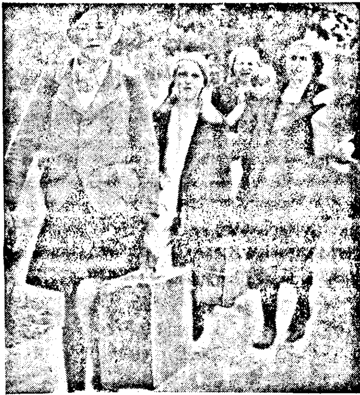
Sudetrundeutsche Kin der und Frauen

In Deutschland wurde von heute an in den Industriebetrieben der 10-stündige Arbeitstag eingeführt.