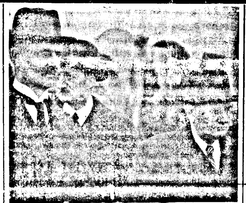
Chamberlain ist wieder bei Hitler

Die Bürger, die schon bisher aus der Riste gestrichen wurden und darüber einen rechtskräftigen Bescheid erhalten, sind verpflichtet, vom Datum des Erscheinens dieses Gesetzes an gerechnet, in einem Monat um die Aufenthaltsbewilligung anzusuchen.