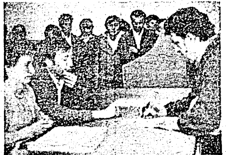
Semnînd Apelul, chimiiștii arădeni se alătură și ei votului nestrămutat de pace a întregului nostru popor.