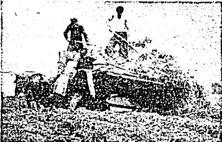
Pentru asigurarea bazei furajere necesare, la C.A.P. Șotronea se acționează din plin la însilozarea masel verzi.