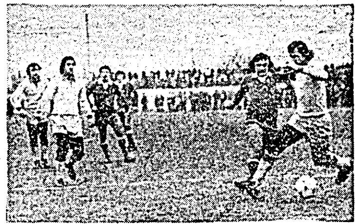
Secvență din meciul U.T.A. — Olimpia Satu Mare

În cadrul pregătirilor pentru returul fotbalistic de primăvară, textileștii au susținut duminică pe terenul Constructor (Mîcălăcea), un foarte util meci de verificare, în compania formației divizionare A, Olimpia din Satu Mare.