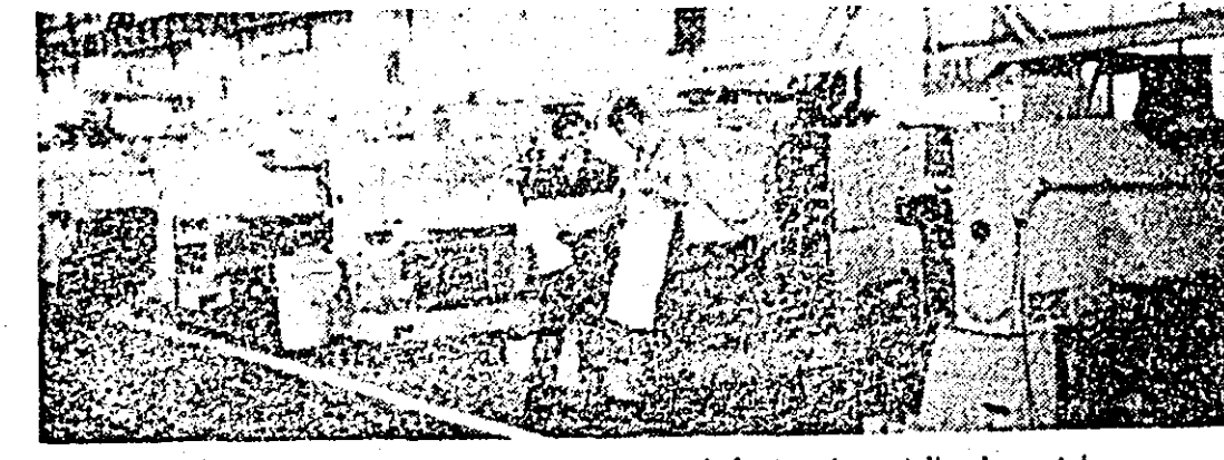
Aspect de la Întreprinderea de strunguri. În imagine, atelierul montaj.