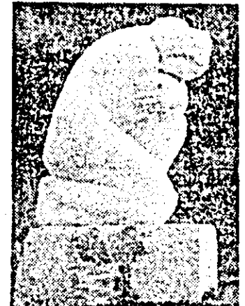
Simpozionul național de sculptură „Zărând” de la Căsoala, organizat de Consiliul județean Arad al Organizației pionierilor, s-a impus cu pregnanță nu numai în spațiul cultural arădean, ci și în cadrul mișcării plastice naționale contemporane. ÎN IMAGINE: lucrarea „IN MEMORIAM PAULIS”, realizată de sculptorul Aurelian Bolea.