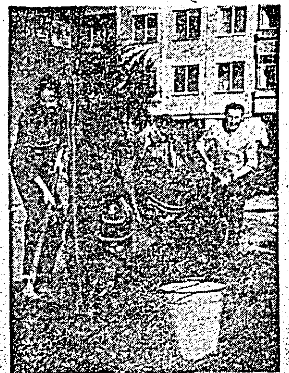
Și alți locatari, cei ai blocului E din cartierul Podgoria, mici și mari, încearcă după puterile lui, se străduiesc să facă mediul ambiant cel mai plăcut.

zat pînă în prezent 4.200.000 lei. Fără îndoială însă că și la Lipova acțiunea de gospodărire a orașului poate fi mult intensificată. Bunoară, locuitorii de pe străzile Ciocîrlie, Pompliorii, Mihai Viteazul și altele nu au înțeles încă acum datorita patriotice ce o au de a participa cu toții la lucrările de înfrumusețare. Este necesar ca în zilele următoare, mobilizați de deputați, de responsabilii de străzi, de comitelele asociațiilor de locatari, cetățenii Lipovei, ca un singur om, să treacă neîntîrziat la această nobilă activitate.