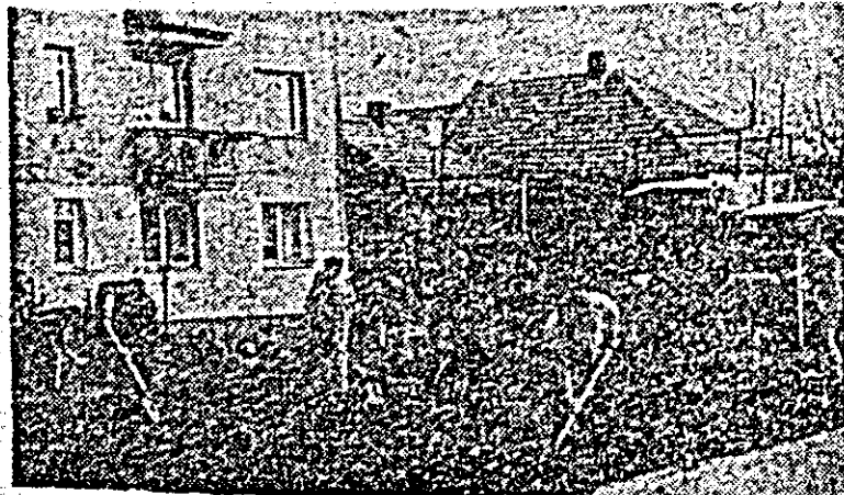
Locatarii blocului 2 B din Calea Aurel Vlaicu lucrînd la amenajarea spațiilor verzi din jurul casei lor.

La îndemnul comunistilor, al deputaților, locuitorii Lipovei au pornit cu elan patriotic la înfrumusețarea și buna gospodărire a străzilor, a parcurilor și caselor. Am străbătut duminică străzile Hajdeu, Iancu Jianu, Matei Corvin, Calea Timișorii și altele, admirînd hărnicia locuitorilor, drumurile și trotuarele curate, spațiile verzi și florale amenajate cu