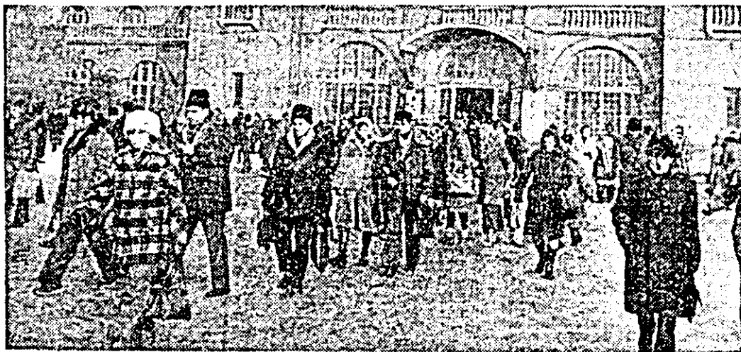
Zi de zi, gara revarsă spre întreprinderile orașului șuvolul mîilor de navetiști...

ins certat cu bunul simț, că efectuează o condamnare la locul de muncă, că a fost sancționat de mai multe ori, că în acea seară o acostase pe B. M. chiar în fața gării, unde sub privirile nepăsătoare (ah! din nou opinia publică) ale celor ce se adunaseră în jurul lor, o insulta. Îi las cu procesul verbal în față, gîndindu-mă la cei 1.500 lei pe care avea să-i plătească pentru neobzăroarea sa. Pentru el, se pare, ticăloșia n-are deșvăț.