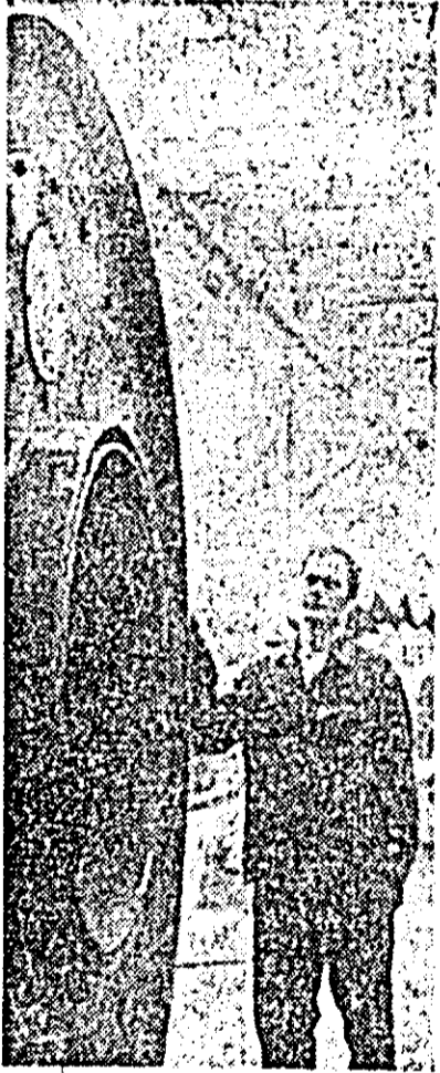
Uzina de fabricație, reparații și montaj în agricultură. O nouă stație de uscat furaje gata pentru a lua drumul beneficiarilor.

Rezultatele obținute pînă acum la ameliorarea terenurilor vor contribui la asigurarea unor recolte mai mari. În venitorii sperăm pentru cel care se străduiește încă din această perioadă să traducă în fapte sarcinile de plan ale acestor ani. A. DUMA