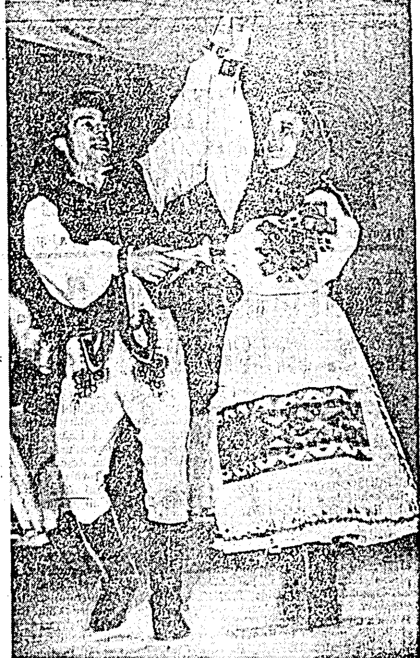
Prin grija partidului, tineretul are create toate condițiile optime de muncă și distracție.