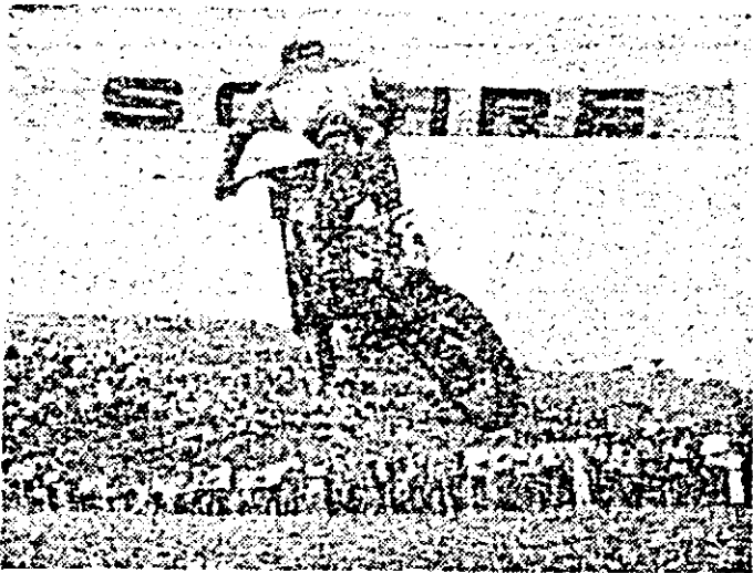
„Salt 212”.