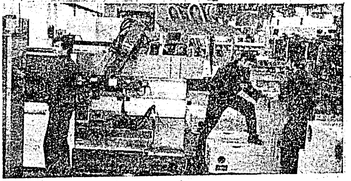
Aspect de muncă în secția montaj a Întreprinderii de mașini-unelte.