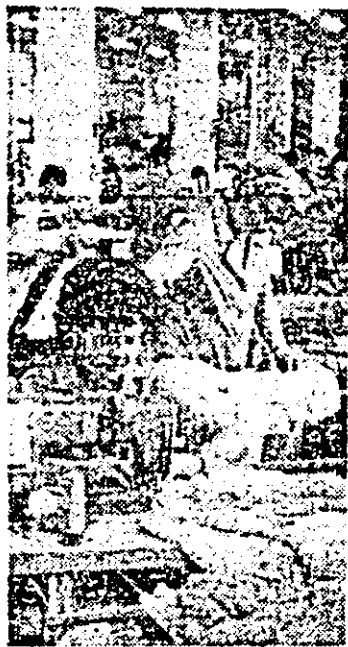
Aspect de muncă de la Întreprinderea de confecții.