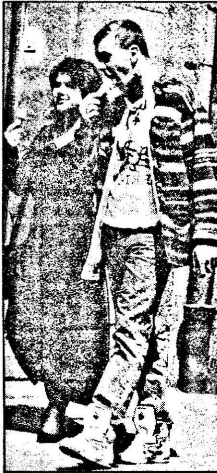
Un dialog... la rece