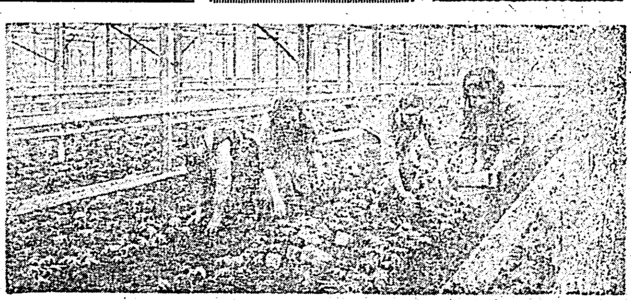
Legumicultorii din Sintana în plină activitate, în clișeu: aspect de la plantatul roșiilor în seră.