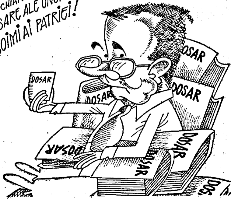
Pagină realizată de HUGO HAUPTMANN

POSEDCHIAR ȘI DOSARE ALE UNOR EX-SOIMII AI PATRIEI!