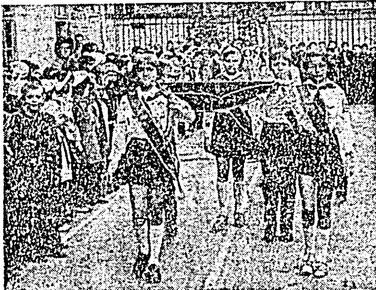
Aspect de la deschiderea festivității.