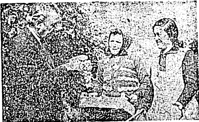
Boabe mari și gustoase are recolta de struguri în această toamnă la noi — afirmă cu deplin temel specialiștii și muncitorii de la I.A.S. Șagu.