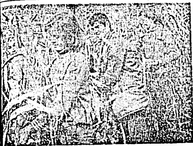
La Liceul Industrial „G. Coșbuc” din Nădlac recoltăm porumbul din lanurile I.A.S.