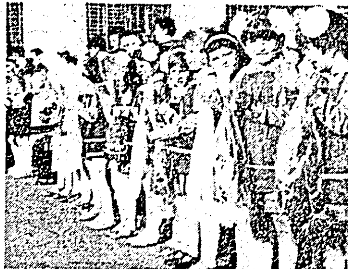
În careul de gală, la prima lor întâlnire cu școala, copiii din Chișineu Criș trăiesc momente de emoții și bucurii.