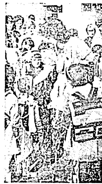
Șoimi ai patriei — la prima întâlnire cu învățătoarea. Instantaneu la festivitatea de deschidere a noului an școlar la Școala generală nr. 18 din Arad.

vîrstei marilor aspirații se adapă de la lumina cărtilor întru devenirea de oameni de care are nevoie patria, oamenii societății socialiste, florile și mîndria de azi și de mine ale poporului. Sigur, au fost prezenți la reînălțarea lor cu școala nu numai colegii, nu numai părinții și bunicii, ci și cei care cu sfială și bujori în obraji pășesc pentru prima dată pe porțile școlii — elevii claselor I. Au fost prezenți de asemenea, ca de fiecare dată, reprezentanții ai organelor locale de partid și de stat, al întreprinderii patronatoare a