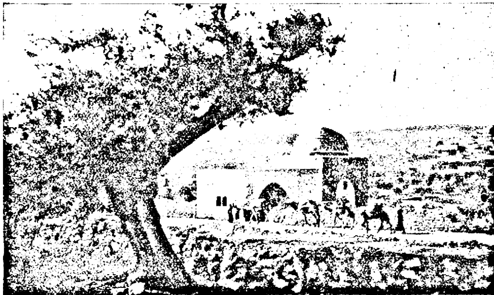
Mormântul Racfelei în drum spre Belceem

și-au schimbat înșășișarea. De obicei, acoperișurile caselor sunt drepte și nu ridicată ca pe la noi. Din pricină că străzile sunt înguste, acoperișurile sunt de mare folos practic. Acoperișurile caselor sunt întrebuițate pentru dormit în nopțile călduroase, pentru odihnă și închinăciune. Seara, care duce pe acoperiș e adeseori afară. Acum înțeleg mai bine de ce Domnul a zis: „Cine va fi pe acoperișul casei, să nu se pogoare să-și ia lucrurile din casă”, Matei 24:17. Apostolul Petru pe un astfel de acoperiș „s'a suit să se roage pe acoperișul casei”. Fapt. 10:9.