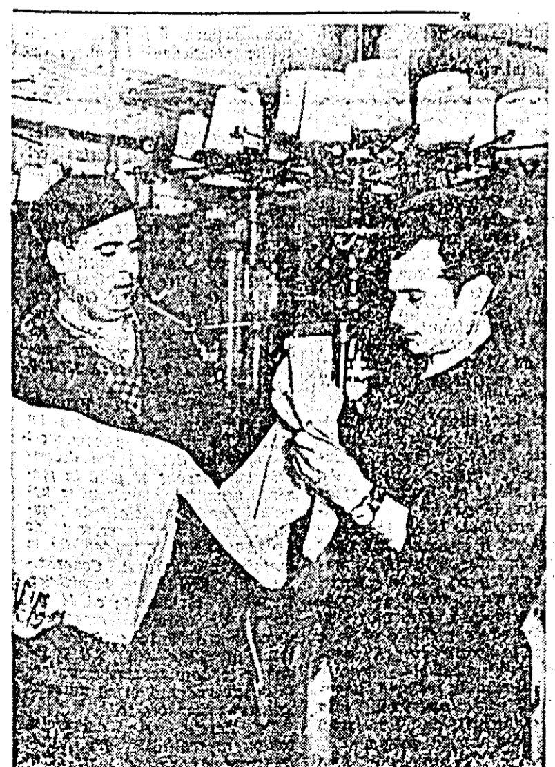
Produsele fabricii „Tricolul roșu” sunt tot mai mult apreciate de populatie. In intrecerea in cinstea aniversarii a 40 de ani de la infiintarea Partidului Comunist din Romania, colectivul fabricii s-a angajat, intre altele, sa imbunatateasca calitatea tricotelor, sa creeze modele noi in sortimente cit mai variate.