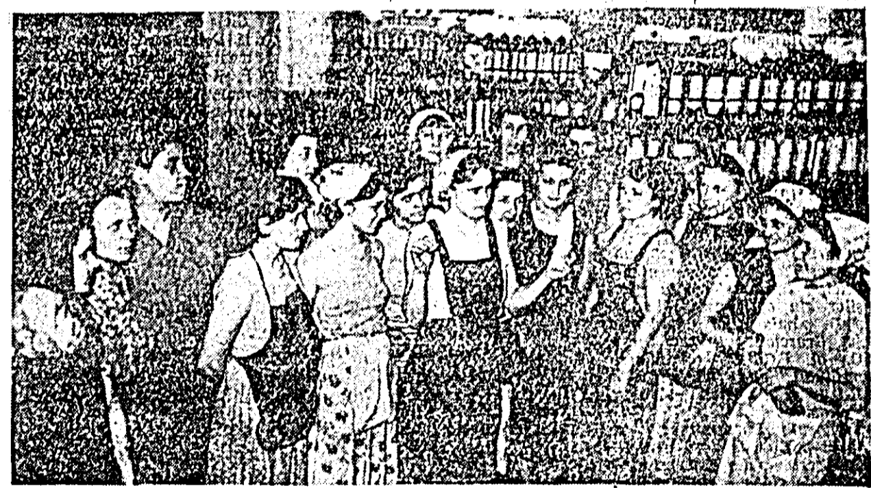
Brigazile UTM din sectorul filatură al fabricii „Teba” participă cu însuflețire la intrecerea socialista in cinstea aniversarii a 40 de ani de la infiintarea partidului, avind ca obiectiv principal imbunatatirea calitatii produselor.

noastre — nu va avea decit de castigat”. Cu acest gând au pornit sa gaseasca defectul. L-au gasit si pina la urma au reusit sa-l remedieze. Mulțumim și-a continuat lucrul cu aceeași exigență.