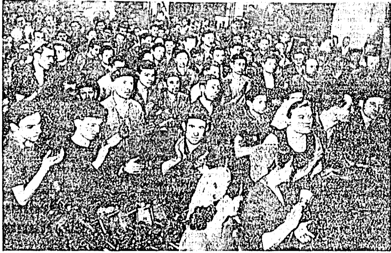
Aspect de la mitingul ce a avut loc la uzina „Iosif Ranghej” cu prilejul luarii angajamentelor in intrecerea socialista.