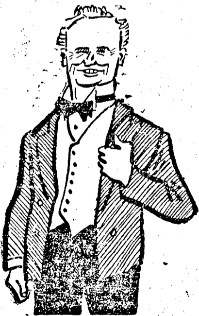
SIR ARCHIBALD SINCLAIR.

Nem osztja Chamberlain miniszterelnök felfogá-