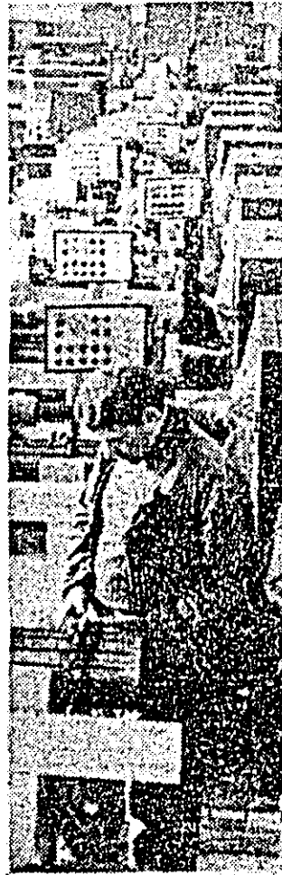
I.M.A.L.A. În atelierul recepției, strungurilor li se face un ultim și exigent control de calitate.

Ca un omagiu adus marelui forum al comunistilor și însușirii de generoase idei și orientări cuprinse în Raportul prezentat Congresului de tovarășul Nicolae Ceaușescu, în toate unitățile economice din județul nostru au continuat desfășurarea zilelor record în cadrul cărora au fost raportate importante depășiri a producției planificate.