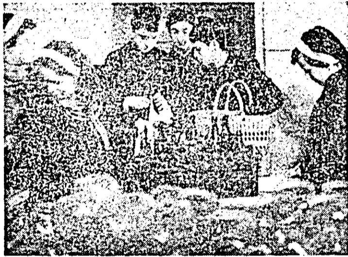
Pionierii de la Școala generală nr. 19 Arad se mîndresc cu faptul că și-au îndeplinit cu cîinst angajamentul economic pe acest an, colectînd și predînd în plus peste 700 de borcane.

Înceind la timp arăturile, veghind la buna iernare a semănăturilor de toamnă, ambele unități au făcut primii pași hotărâți spre producții cât mai mari în anul 1982. Pași ce trebuie continuați, acordîndu-se grijă efectuării la timp și calității tuturor lucrărilor ce urmează pe lungul drum pînă la strîngerea recoltelor viitoare.