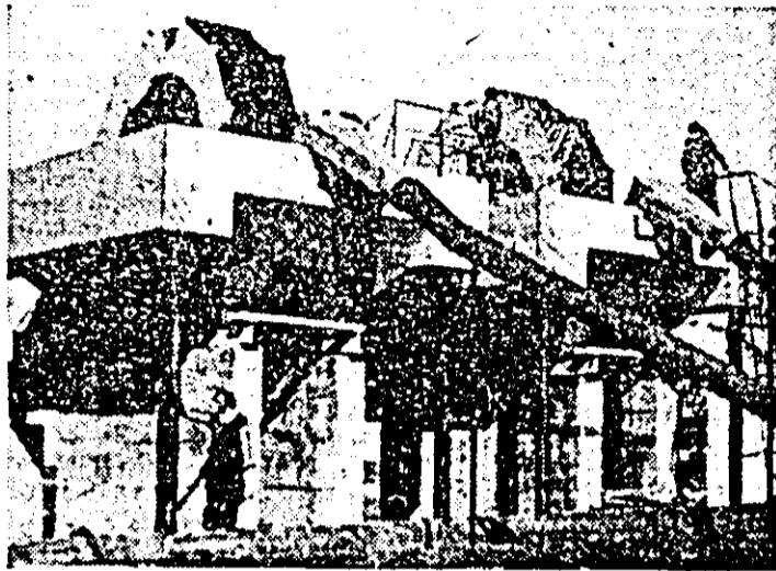
Vedere exterioară a noului stații din Micăleca pentru extragerea nisipului, stație recent dată în folosință de I.E.I.A.M.C.