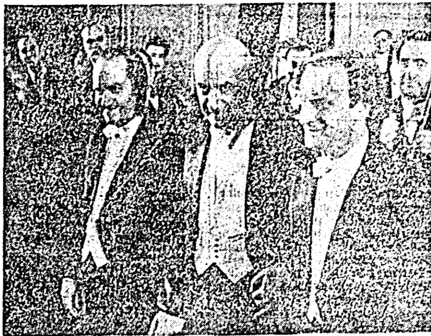
In clipșu: o scenă din filmul „Două viori”.