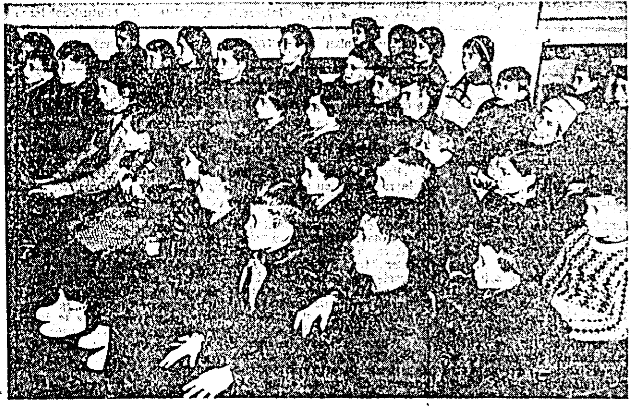
Casa Pionierilor din orașul Arad organizează pentru pionieri și școlari numeroase activități instructive și educative.