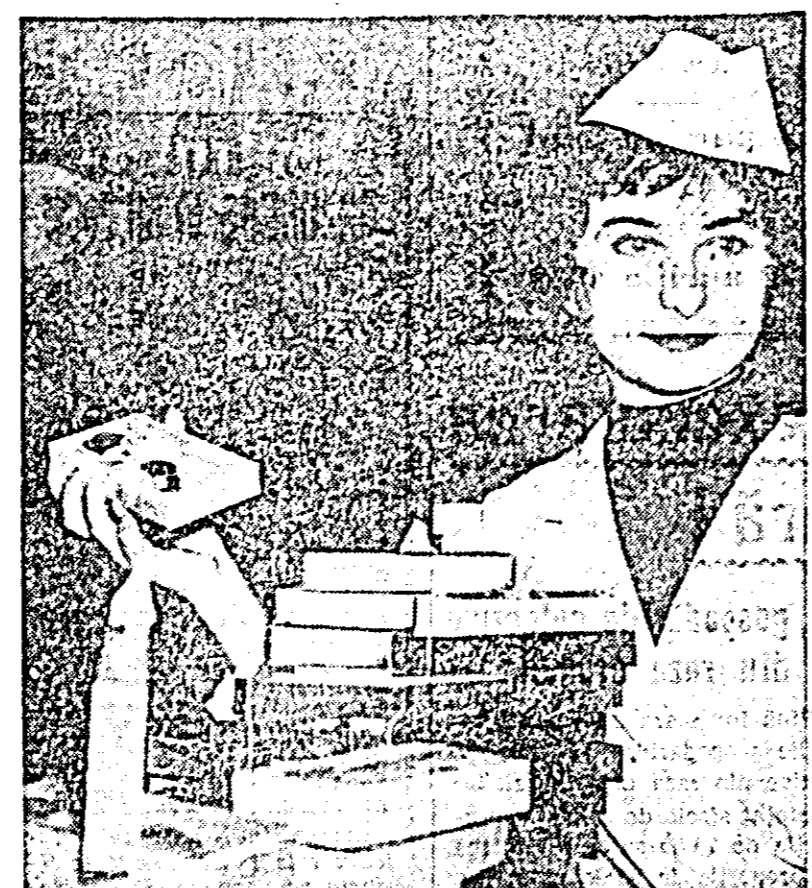
Cartea este iubită în rândurile muncitorilor de la Fabrica de confecții

Că la sectorul autobuze nu se dă atenția cuvenită rezolvării sesizărilor și reclamațiilor o dovedește și faptul că aici condița de sugestii și reclamații a stat o vreme nenumărată.