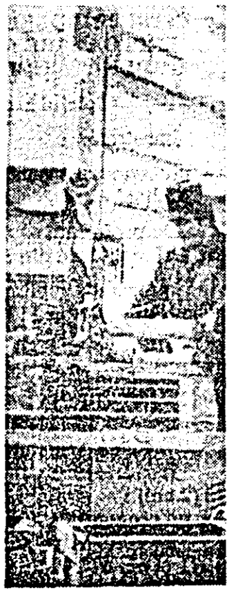
Întreprinderea de mașin-unelte. Aspect de muncă în secția montaj.