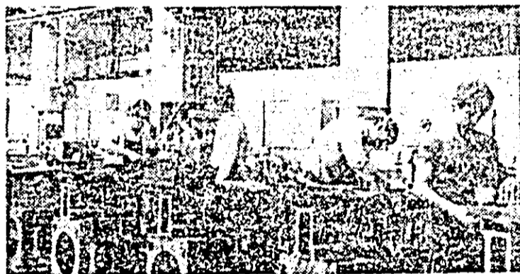
În imagine: Aspect de muncă în secția montaj a I.M.U.A.